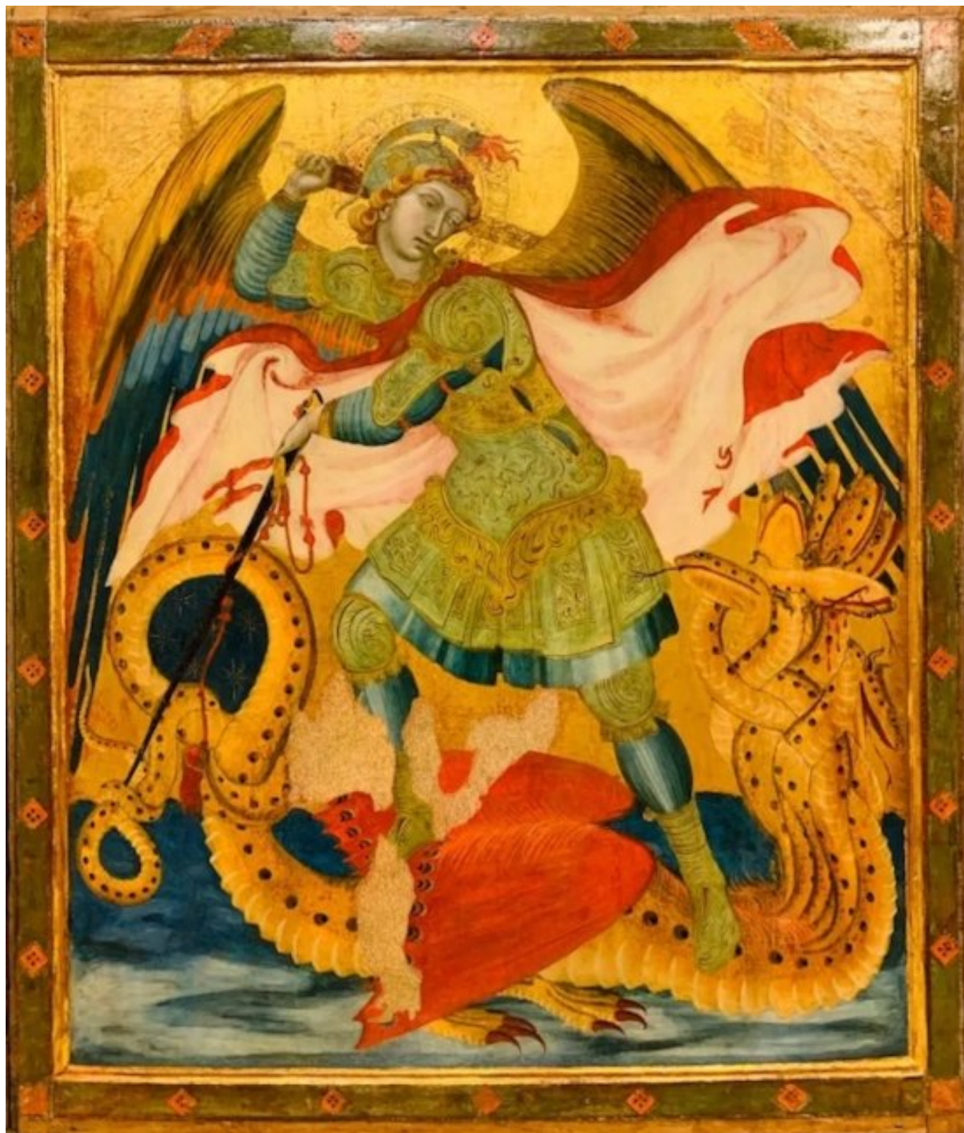
Michael, peinture d'Ambrogio Lorenzetti