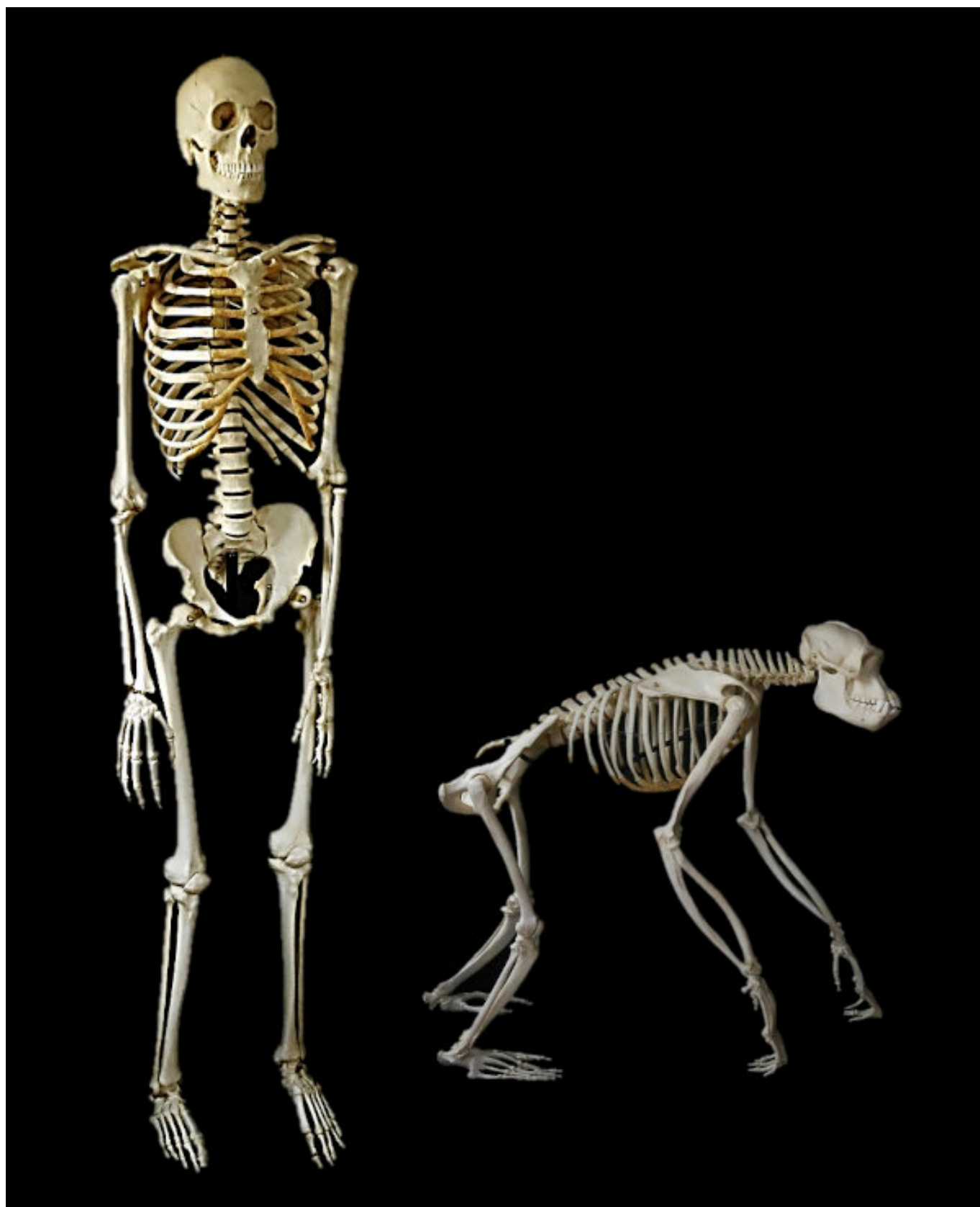
Fig.1 : Être humain et chimpanzé