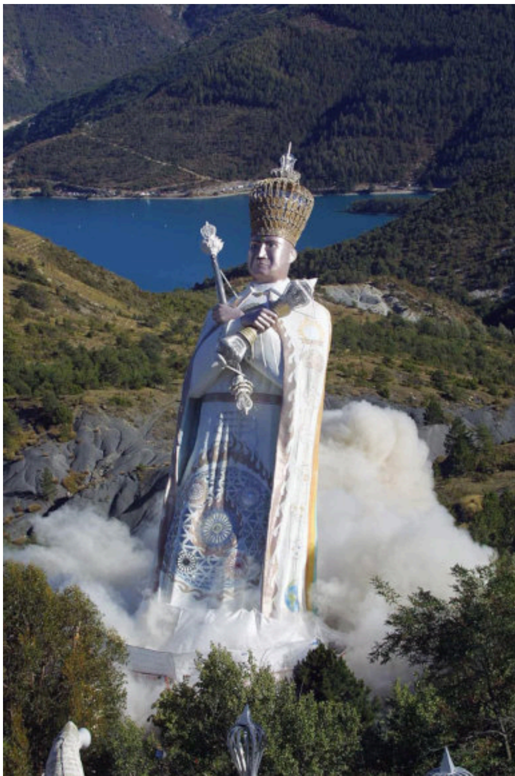
Démolition de la statue de Gilbert Bourdin édiflée par la secte du Mandarom à Castellane