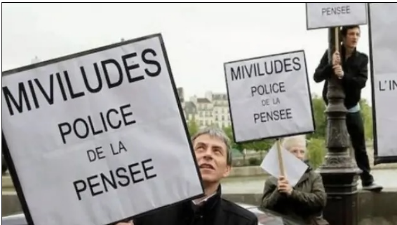
Manifestation contre la MIVILUDES à Paris.

La MIVILUDES , la Mission interministérielle de vigilance et de lutte contre les dérives sectaires, qui dépend désormais du ministère de l'Intérieur, a publié la semaine dernière son rapport pour les années 2018-2020 .