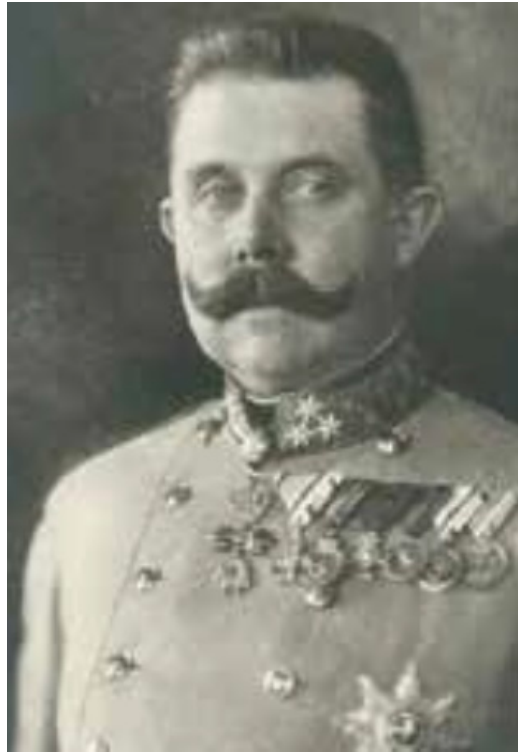
L'Archiduc François Ferdinand

découverte très étonnante à ce sujet. Le 30 septembre ( GA174b ) et le 31 octobre 1914 ( GA157 ), Steiner fit part pour la première fois à des auditeurs anthroposophes du résultat de son enquête occulte, qui le surprit lui-même.