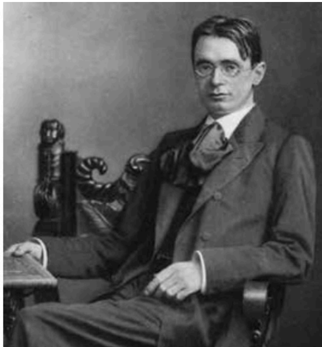
À gauche : Georges-Marie Picquart - À droite : Rudolf Steiner

Malheureusement, Rudolf Steiner n'a pas révélé l'identité de son informateur. Celui-ci aurait sans aucun doute été compromis ou lésé de manière durable par les « dirigeants de l'État français ». Mais Steiner n'était pas un fantaisiste. Il devait en quelque sorte brûler de faire éclater cette vérité sur Dreyfus, qu'il avait toujours considéré comme innocent, ainsi que sur l'ensemble de l'affaire.