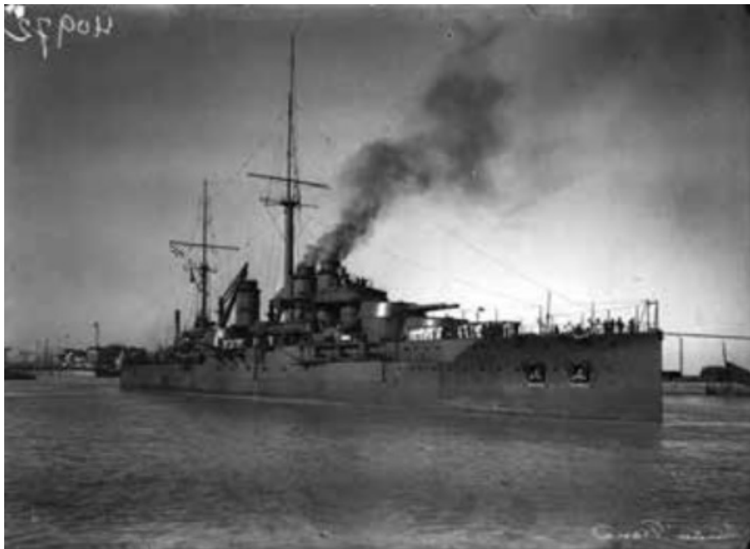
Le navire de guerre La France