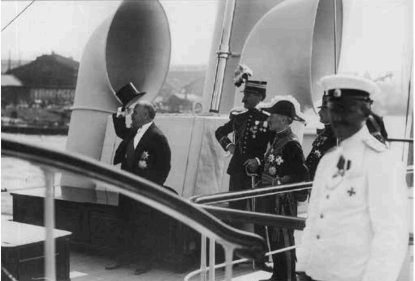
Raymond Poincaré à son arrivée en Russie

Le 20 juillet ? C'était le jour de l'arrivée de Poincaré à Saint-Pétersbourg ! La visite d'Etat devait durer trois jours et s'accompagner d'un faste militaire et politique considérable. « L'immense cuirassé qui nous amène le chef de l'Etat français », écrit avec emphase Maurice Paléologue, l'ambassadeur français à Saint-Pétersbourg, « justifie pleinement son nom, c'est bien la France qui vient à la rencontre de la Russie. Je sens mon cœur battre plus fort ». [2]