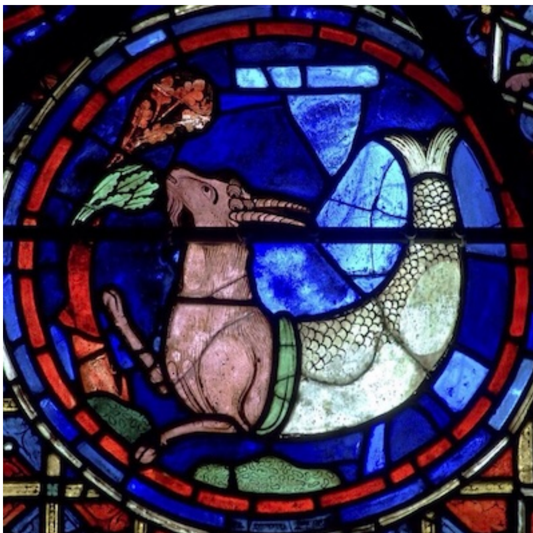
Le capricorne : vitrail de la cathédrale de Chartres

Le troisième aspect est celui du Verseau. Mais regardez un peu l'ancien signe du Verseau ; il ne représente pas quelqu'un qui barbote dans l'eau ; dans la vraie représentation zodiacale, on voit quelqu'un marcher sur la terre ferme, dans un pré ou dans un champ qu'il fume en y versant de l'eau fertilisante. C'est l'homme qui représente le cultivateur, ce troisième métier que l'on pratiquait en ces temps primitifs où l'on avait un savoir instinctif de ces rapports-là : métiers de chasseur, de berger, de cultivateur.